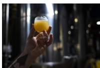
brasserie La Débauche

☎ 05 86 07 70 65 www.brasserie-ladebauche.com